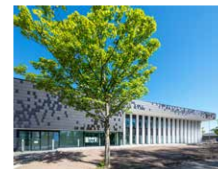
Het experience center Trespa van Weert, dé referentie in HPL-platen, heeft een unieke uitstraling.