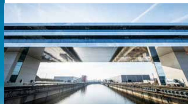
Limeparts-Drooghmans mocht de gevel van de markante nieuwe hoofdzetel van Cordeel in Temse bekleden.

Tekst Liesbeth Verhulst | Beeld Limeparts-Drooghmans