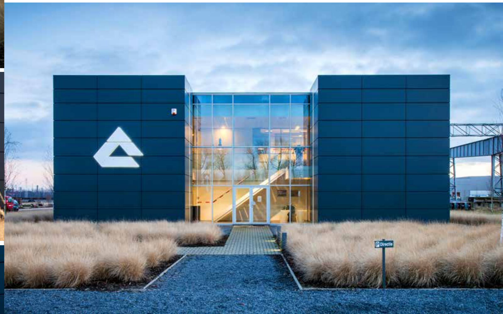
Aelterman Gent: aluminium cassettegevelbekleding met geïntegreerde LED-verlichting. Ontwerp: Luc Coene.