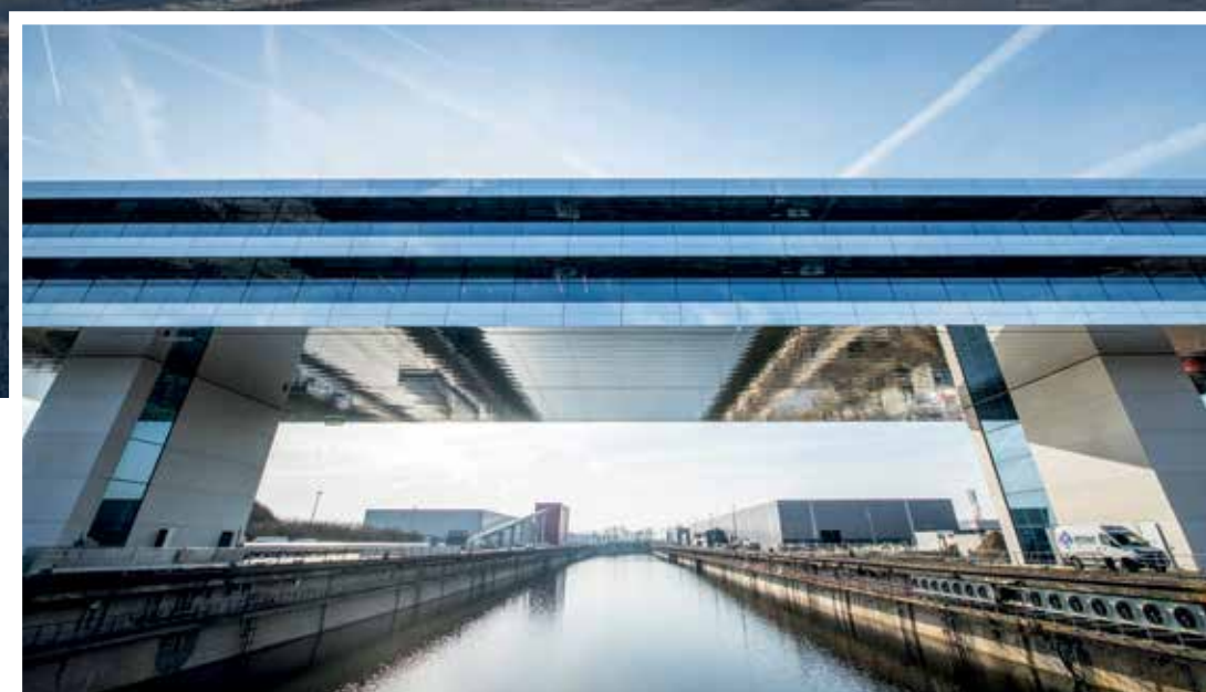
Gezien de specifieke ligging op het voormalige droogdok was het plaatsen van de gevelpanelen geen sinecure.