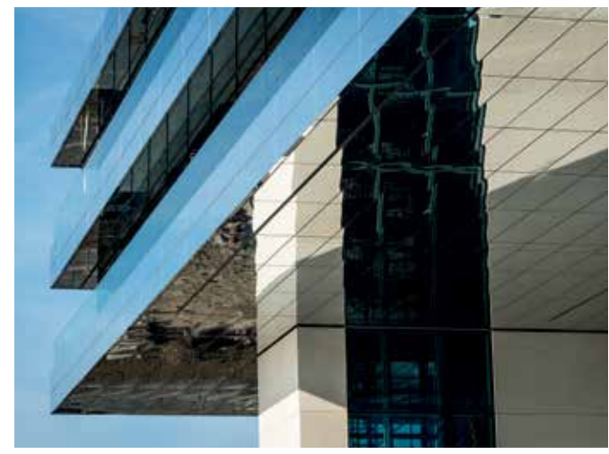
Dankzij de spiegelende gevelpanelen is het nieuwe hoofdkwartier ook een architecturaal hoogstandje.

“De spiegelende gevelpanelen geven het gebouw telkens weer een andere aanblik in functie van de tijd en de weersomstandigheden”